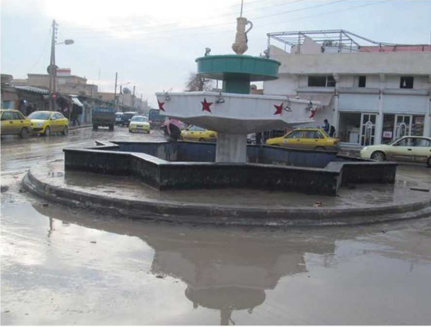
ساحة الحرية (البلدية سابقاً) في الشارع الرئيسي بتل أبيض