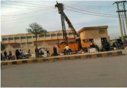
عمال الكهرباء في تل أبيض

بعد سقوط النظام، وتشكيل حكومة انتقالية، سنقوم بحل المجلس إن طلب منا ذلك.